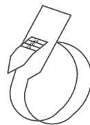
Ejemplo talla 24

Si no dispones de anillo de referencia, puedes recortar las siguientes figuras que te ayudarán a tomar la medida de tu dedo. Haz un corte en la línea marcada con las tijeras. Después, ajusta bien el papel, y, con los números hacia fuera pídele a alguien que ajuste el medidor. Esta es una operación en equipo: si tomas la medida por tu cuenta no será fiable. Recuerda que no se debe apretar mucho, lo justo para que el medidor pueda entrar y salir del dedo con normalidad, como si fuera un anillo real.